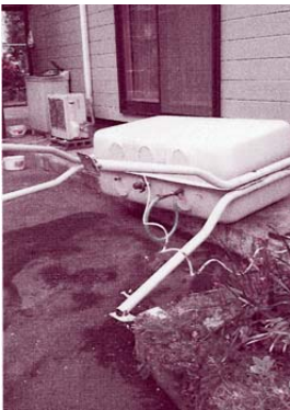
ホームタンクの転倒